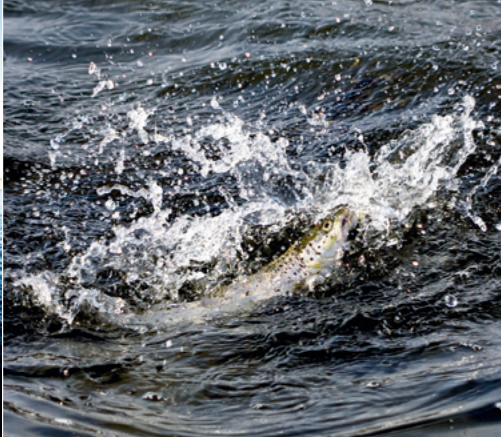
Reke, tangloppe- og børstemarkimitasjoner har vist seg som sikker «sjørretmat» på Vestfoldkysten.